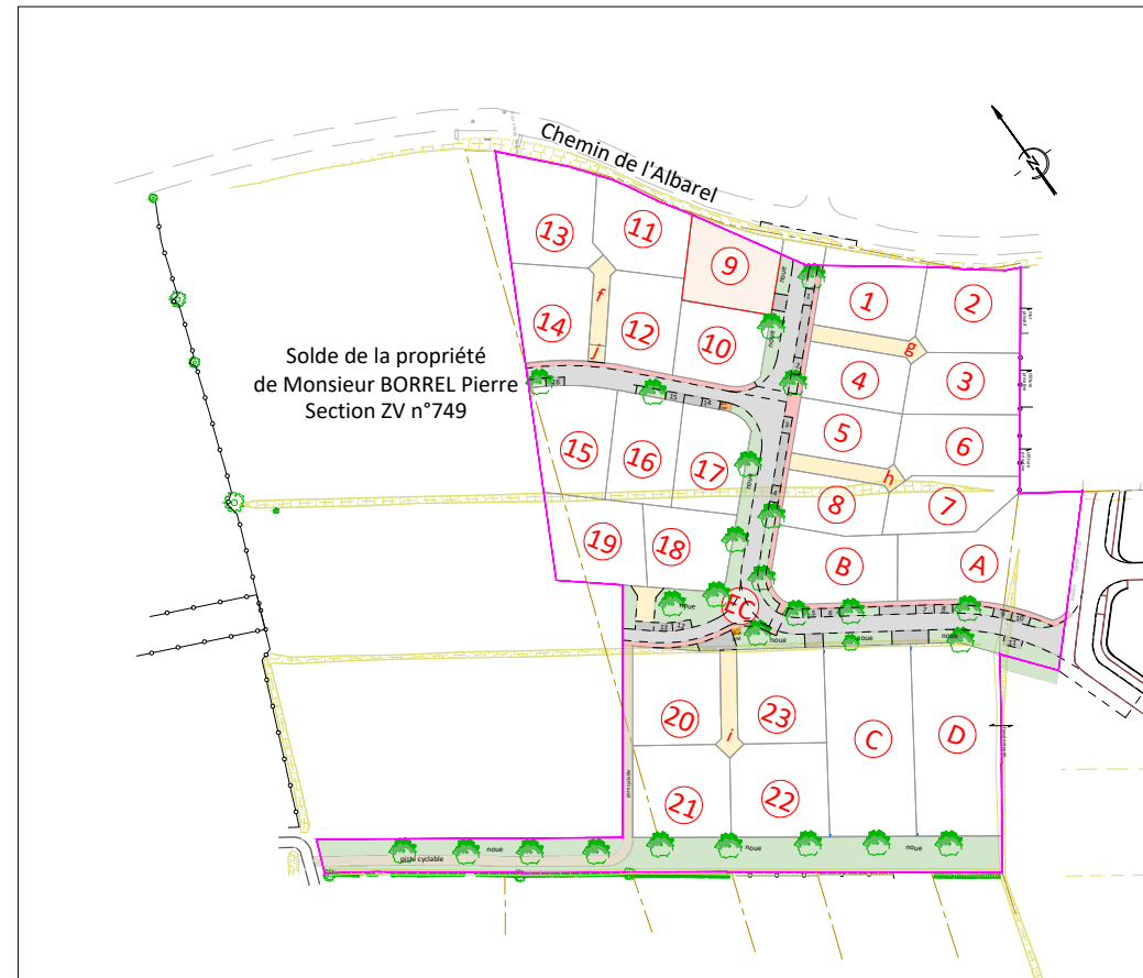
Plan d'ensemble - Echelle 1/2500